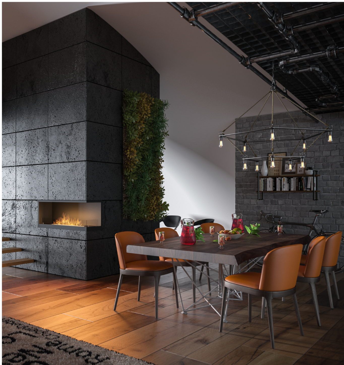
Biokominek Inside P1100v2